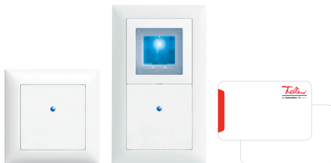
Lecteur RFID overto comme appareil individuel et en combinaison avec le scanner d'empreintes overto ainsi que cartes RFID.

Le système d'accès biométrique overto est complété par un lecteur RFID en design EDIZIOdue. Associé à une carte RFID, il permet l'accès à des personnes qui viennent irrégulièrement (fournisseurs) ou seulement pour un certain temps (artisan). En combinaison avec le scanner d'empreintes overto Net, il garantit de plus un niveau de sécurité augmenté. Le lecteur RFID ne peut être utilisé qu'en association avec overto NET et il est totalement intégré dans le logiciel Net ekey.