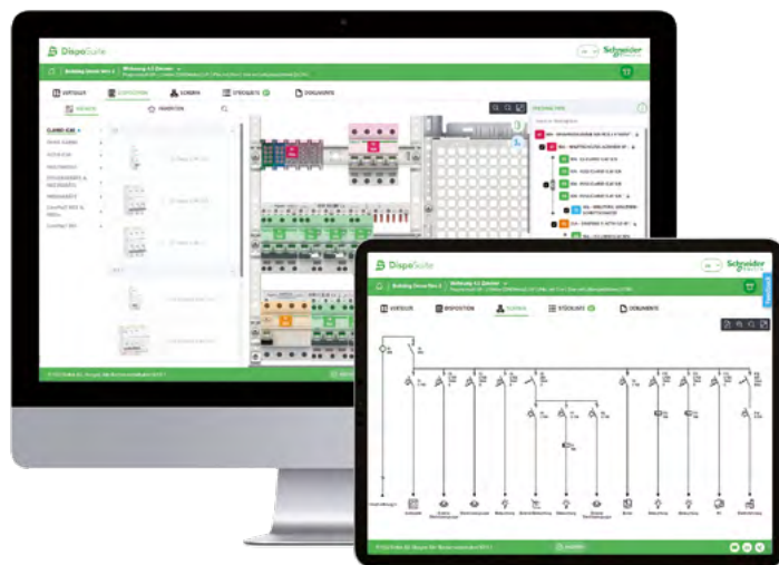
Schémas unifilaires pour les mini-distributeur et Pragma multi