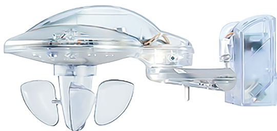
Station météo Wisser

La station météo Wisser by Feller offrira à l'avenir une protection optimale des bâtiments. Elle mesure le vent, la pluie, la température extérieure ainsi que l'intensité lumineuse et envoie les données au module AMD de la station météo. Elle protège les stores à rouleaux, stores à lamelle et marquises de dommages en les rentrant automatiquement en cas de vent trop fort ou de pluie trop forte. Les seuils, par ex. pour le vent et la pluie sont réglables séparément pour chaque groupe de protection dans l'appli Wisser eSetup. La protection contre la grêle est également possible, par ex. avec une boîte de signal AEAI pour la protection contre la grêle connectée à l'entrée sans potentiel du module AMD. Le module AMD constitue l'interface avec la station météo par le conducteur RS-485 et avec l'installation Wisser par le fil K+, à une condition: disposer d'un appareil WLAN de génération B.