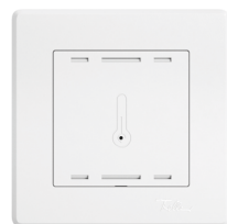
Sensore di temperatura